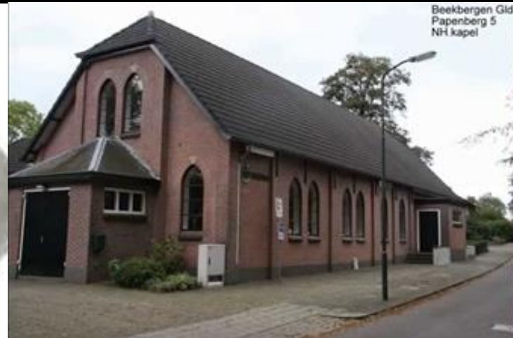
Beekbergen Gld Papenberg 5 NH kapel